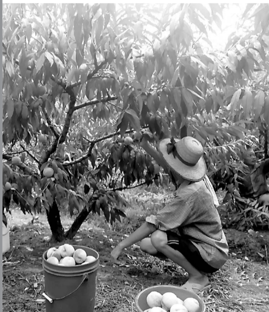
昨天,余姚市阳明街道姚驾桥村应巷桥自然村水蜜桃种植基地,桃农争分夺秒抢收水蜜桃,并进行果园的田间管理。