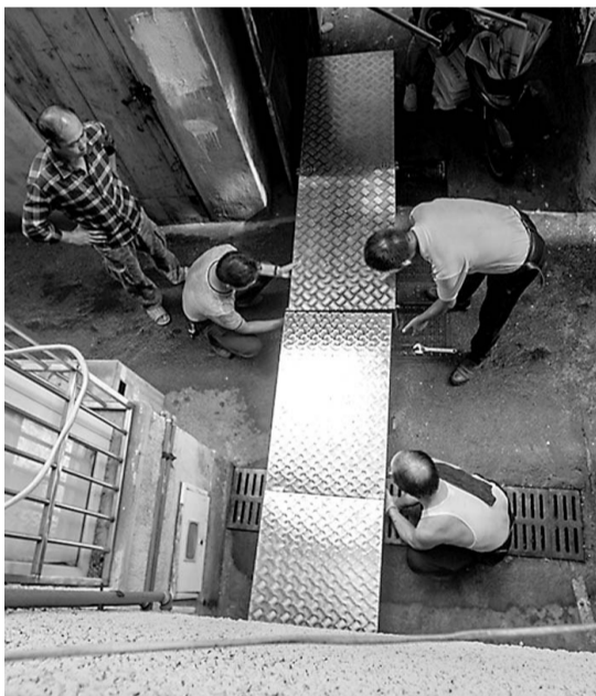
海曙区马园社区地势低洼,台风一来很容易积水,为了确保楼道居民能安全出行,昨天下午,马园社区提前为容易积水的楼道搭建了便民桥。