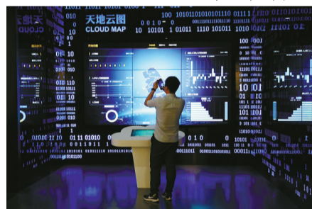
宁波城市展览馆内