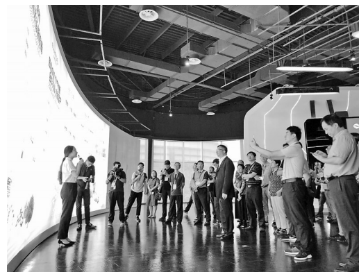
全国晚报人参观上海电气。