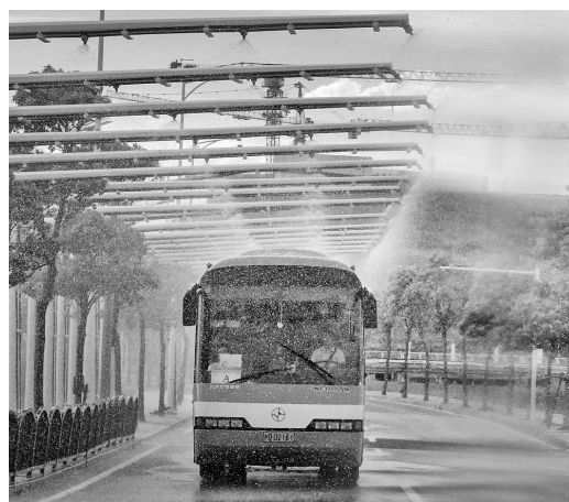
为了让无人驾驶车更“聪明”，上海智能网联汽车综合测试示范区提供33类功能场景测试，图为模拟雨雾环境。