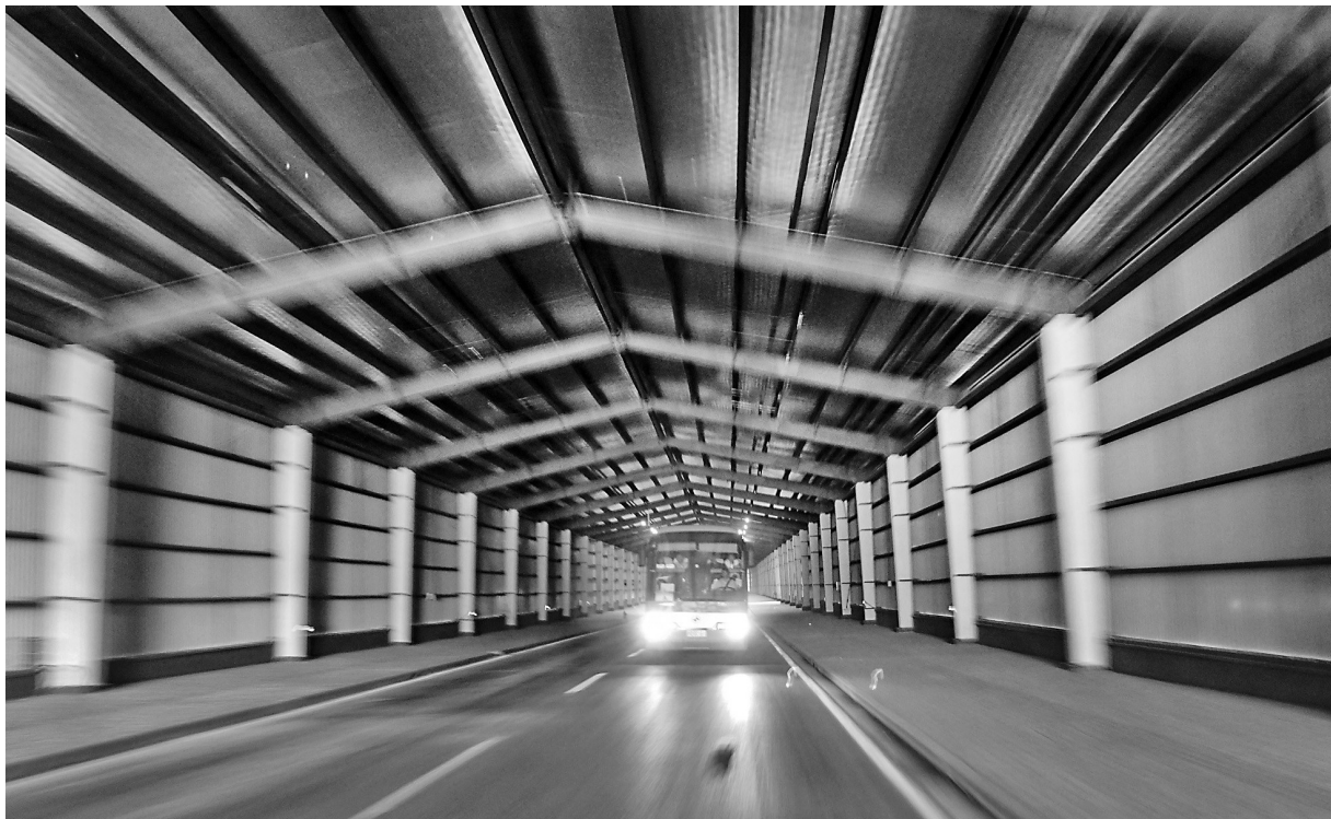
上海智能网联汽车综合测试示范区特地为训练无人驾驶车辆建的无卫星导航隧道。