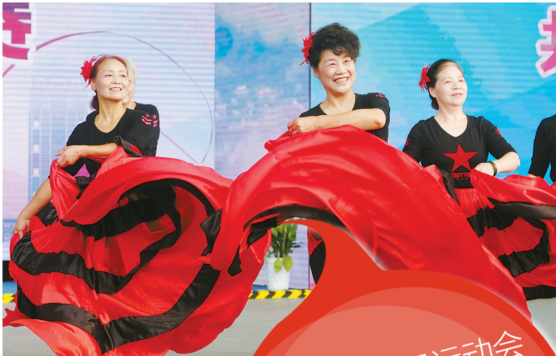
广场舞总决赛现场。

昨天,宁波市首届全民运动会广场舞总决赛在国际会展中心1号馆广场拉开帷幕。这是宁波市人民政府主办、宁波市体育局承办的60个群众项目之一,参加总决赛的共有63支队伍近1200人,其中包括来自各区县(市)选拔赛的优胜队伍。