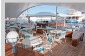
霞飞路烧烤餐厅实景