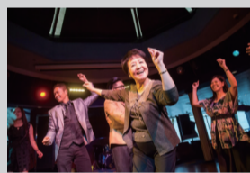
邮轮上的精彩表演