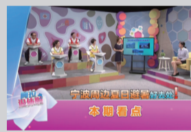
《阿拉退休啦》节目剧照