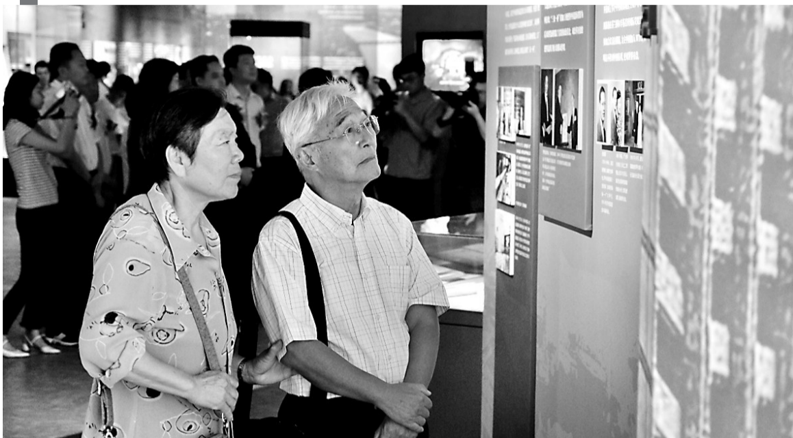
市民在参观展览。

本报讯(记者 房伟) 昨日上午,《与祖国同行——宁波帮与共和国70年特别展》在宁波帮博物馆正式开展。展览回顾了一代代宁波帮人士在不同领域为共和国成立和发展所作出的贡献,为新中国成立70周年献礼。