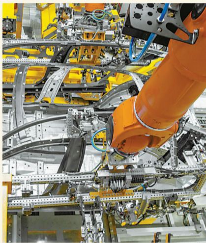
工业现代化

70年来,宁波地区生产总值从1949年的2.2亿元跃升到去年的10746亿元,名义年均增长13.1%,成为全国第15个GDP超万亿元城市;按常住人口计算,人均GDP跃升到13.3万元,达到高收入国家水平。财政总收入从1978年的5亿元跃升到去年的2655.3亿元,年均增长17%。