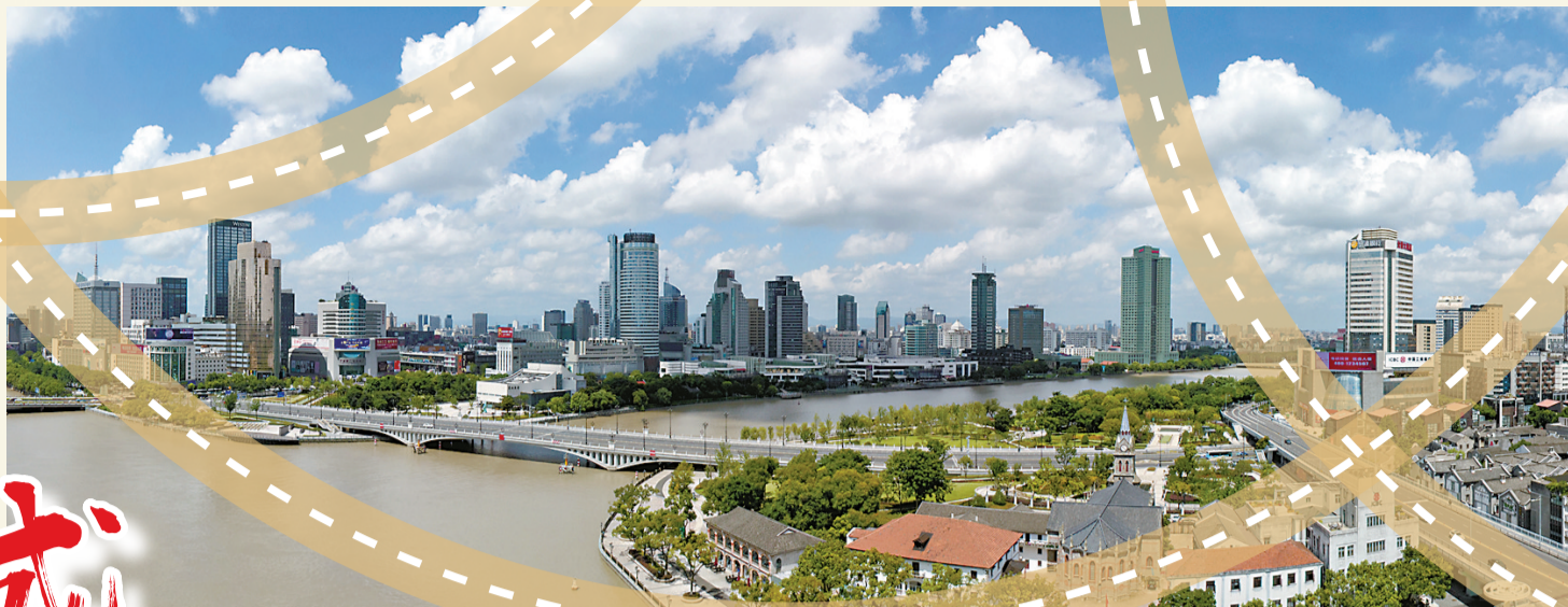
宁波新貌·三江口