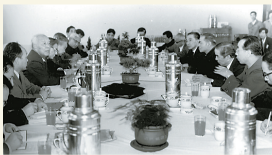
1985年10月29日，国务院副总理万里率国家有关部门负责同志在宁波召开现场会议。

1984年之前的宁波基础设施相当落后，投资硬环境很差，城市很少为外人知晓，“宁波？宁波在哪儿呀？”1984年以后，宁波远渡重洋招商引资，融入国际市场发展大潮，开放型经济日渐活跃，并逐渐走在了沿海开放城市的前列。如今，灵敏开放、善夺先机已成了宁波经济最鲜明的一抹底色。