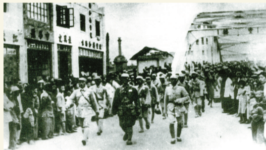
宁波解放，解放军通过灵桥。

新中国成立70年，也是浙东名城宁波焕发新生的70年，让我们在70年的时间里，撷取几朵夺目的浪花，来折射城市进步与发展的重要轨迹。