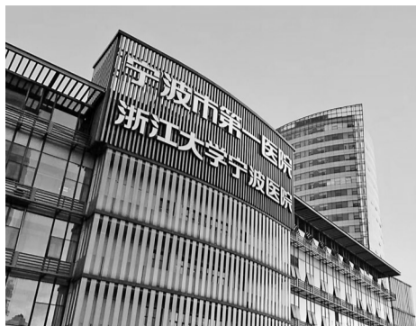
宁波市第一医院门诊楼外景。