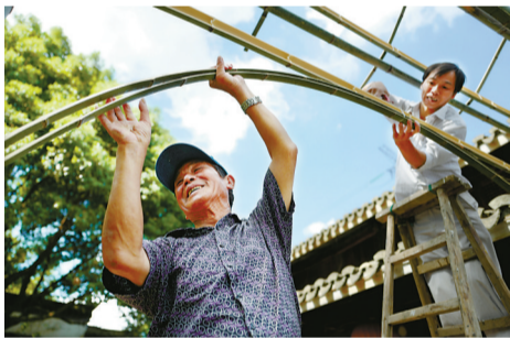
搭建彩牌楼的架子。