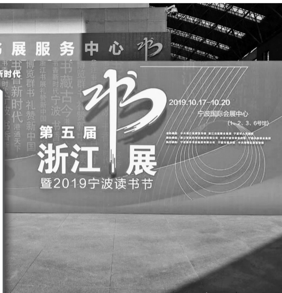
国际会展中心主会场前浙江书展巨幅宣传海报。