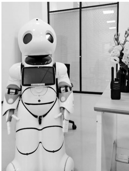
机器人将出现在书香宁波馆。