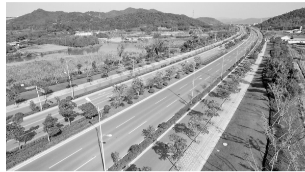
已经建成通车的鄞城大道东钱湖至横溪段。