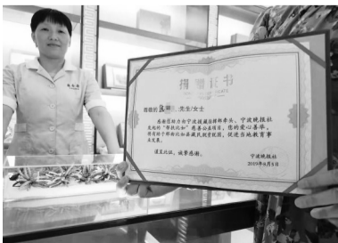
市民买比如虫草的钱,一部分将捐给比如县。

随着天气转凉,来买虫草的客户也多了起来。前两天,《宁波晚报》养生汇来了位叔叔,让我们帮忙看看他