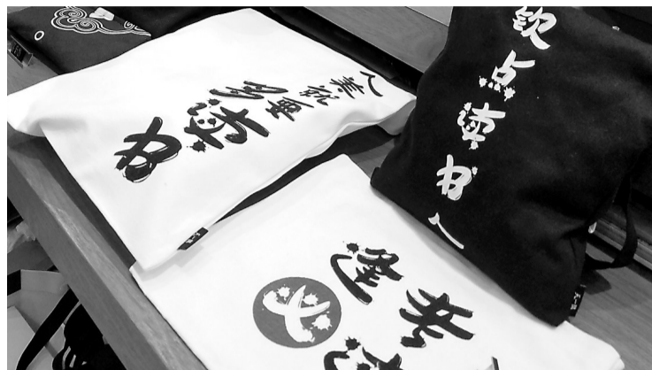
天一阁推出的这两款书袋很受欢迎。

昨天是周六,正在举行的第五届浙江书展暨2019宁波读书节主会场宁波国际会展中心,迎来了第一波逛展高峰:各个展馆里都是人头攒动。逛展人流中,很多是家长带孩子一起来感受书香氛围的“亲子团”,中小生成成为逛展主力军,很多人都买了一擦擦的书,而天一阁的“人美就要多读书”“逢考必过”书袋等文创产品则成了销售爆款。