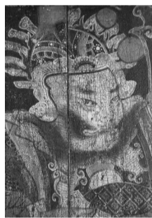
江南内房家具绘画代表作品。