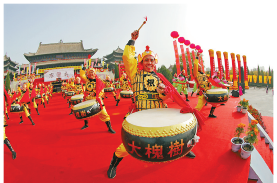
气势磅礴的威风锣鼓