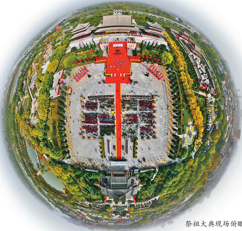
祭祖大典现场俯瞰图