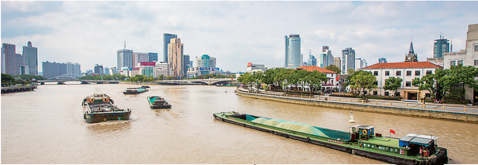
航行在三江口的货船。