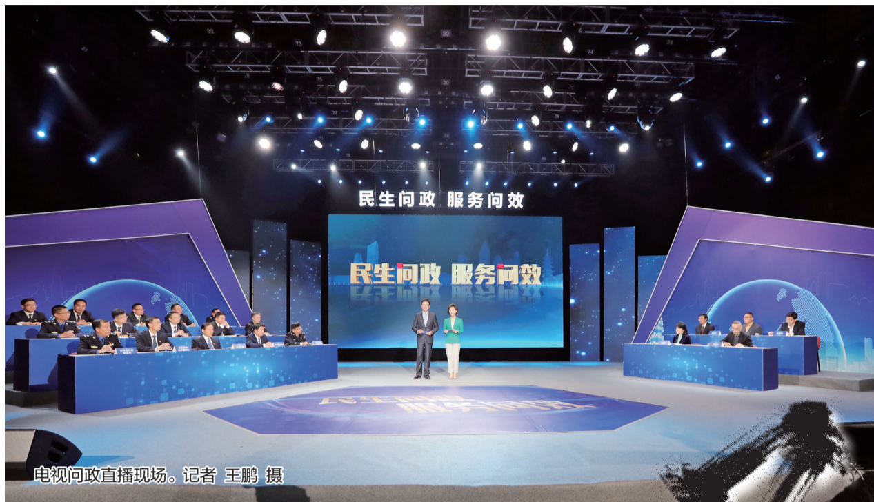
电视问政直播现场。