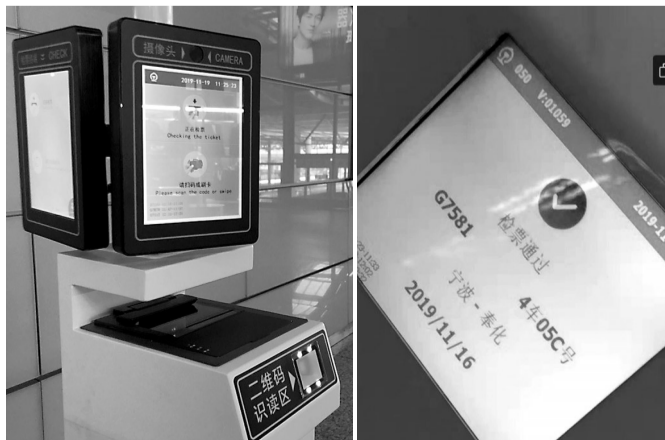
在铁路宁波站,人工通道安装了新设备。