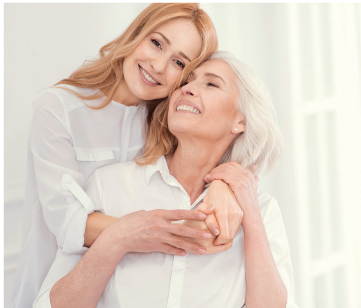
年轻干燥皮肤实测