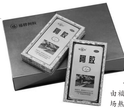
贡胶糕由福牌1856现场熬制。