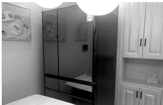
冰箱放不进预留位。