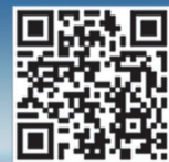
打开甬恋APP扫描绑定邀请码或手动输入邀请码777777