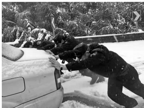
2016年1月22日，横街派出所民警雪中救援。

海曙西部片区山川绵延、风景秀美，吸引了众多游客前往游玩，不过，游客迷失山野的险情也时有发生。在周边的几个派出所里，有一群担负起深山救援任务的警员，他们熟悉脚下这片土地，一有警情便奋不顾身，寒冬、深夜入山搜救早已是家常便饭；他们有勇有谋，往往在遭遇“山重水复疑无路”的困境时，也能找到“柳暗花明又一村”的希望。昨天，记者走访了海曙横街派出所、章水派出所和龙观派出所，倾听这些救援人员的故事。