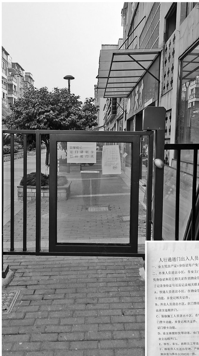
天慈良园小区人行通道安装了门禁系统。

物业公司在接受记者采访时表示,封闭管理为的是小区安全,这事半年前就讨论过,相关记录现在已经找不到了;另外,这事单项资金开支不大,没有强制性公示的规定。