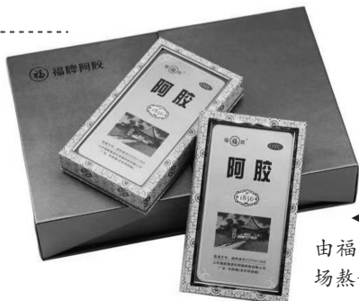
贡胶糕由福牌1856现场熬制。