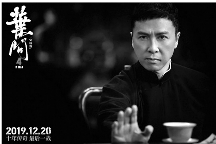
2019.12.20 十年传奇 最后一战