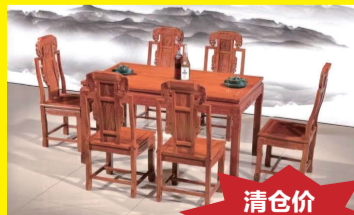
花梨木小象头餐桌