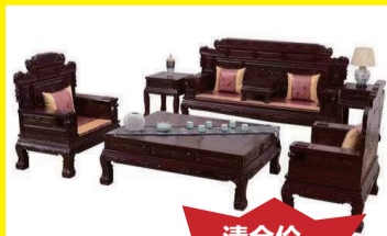
酸枝木财源滚滚沙发