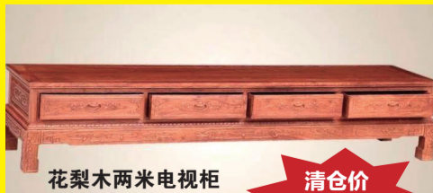
花梨木两米电视柜

规模大、款式全，小叶紫檀、大红酸枝、黑酸枝、花梨木、缅甸花梨等应有尽有(可以私人定制)