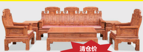
花梨木小象头沙发