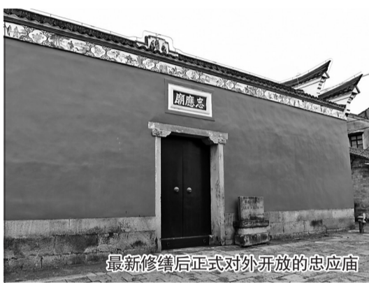
最新修缮后正式对外开放的忠应庙

此一行程被其记录在不足300字的一篇《鄞县经游记》中，比起游记，这篇文章更像是一份工作报告，成为后人览其治鄞风采的第一窗口。