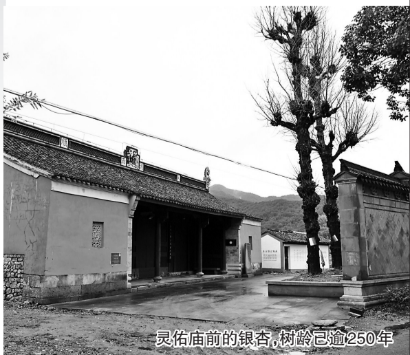
灵佑庙前的银杏，树龄已逾250年

2019年12月18日，王安石诞辰998年当天，修缮完毕的忠应庙即王安石纪念馆正式向社会开放，与十里四香、下水湿地等景观连成一体。看门人也是下水村人的史师傅，热心向游客介绍着庙里的一切，“王安石呀，27岁就当县令了……”千载之下有余情。