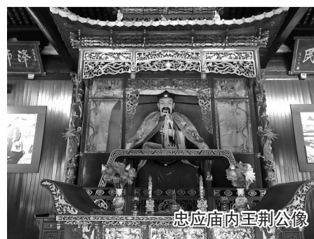
忠应庙内至荆公像