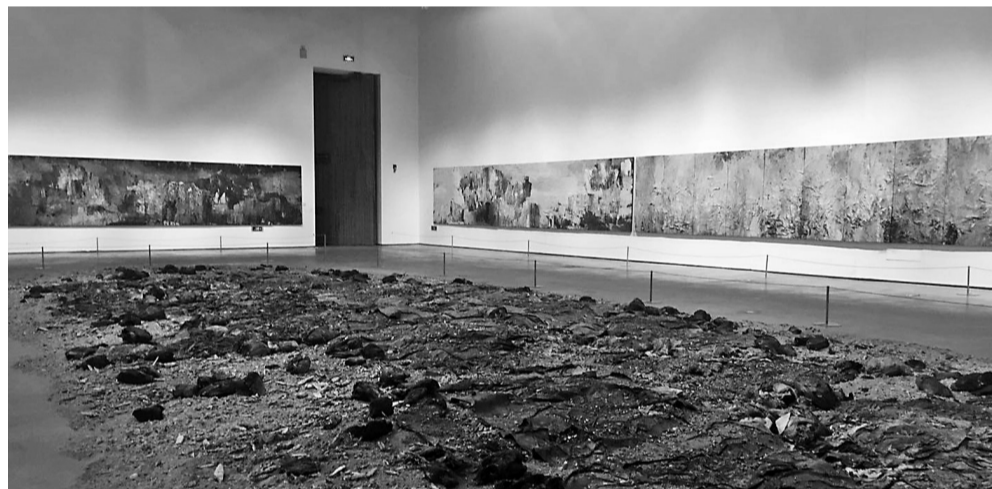
大型装置作品《海滩》

据悉,本次展出的作品注重对宁波历史语境的发掘与凸显,因为宁波是中国近代史上最早的开埠港口之一,“潮”象征着宁波港口对中国近代文明演化的推进作用。昨天,记者提前探营布展现场,挖掘这场大展的文化亮点。