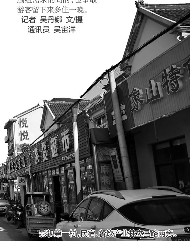
影视第一村，民宿、餐饮产业林立马路两旁。