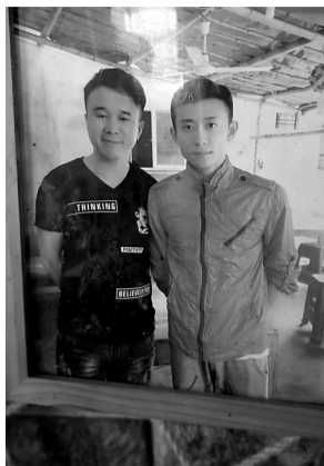
餐饮老板和张一山合影。