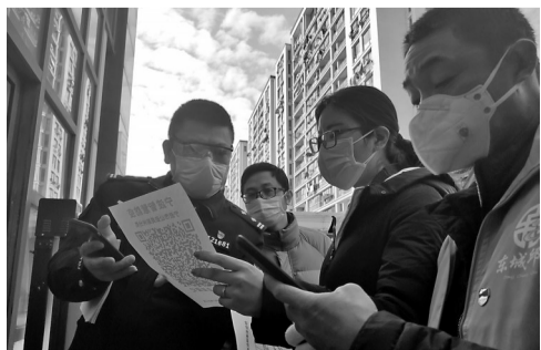
社区民警宣传宁波全域一码通使用需知。