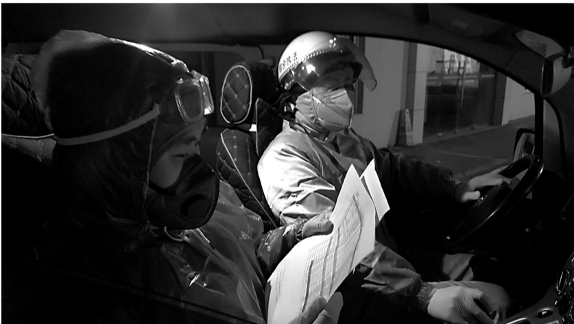
段塘街道护卫队深夜护送隔离人员。