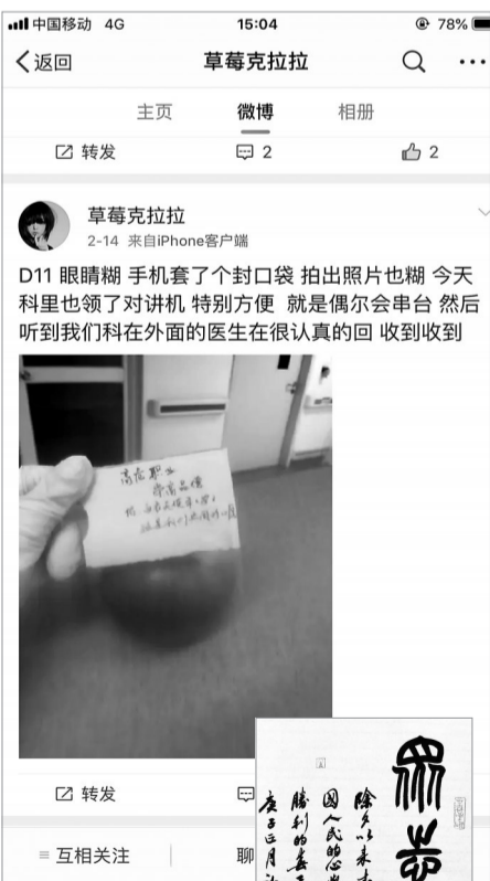
▲隔离病区护士的微博日志。