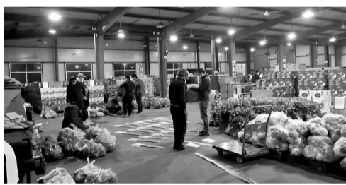
机关干部连夜帮助企业配送蔬菜。