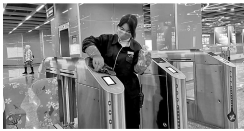
为确保乘客健康出行,服务人员运营车站进行全面消毒处理。