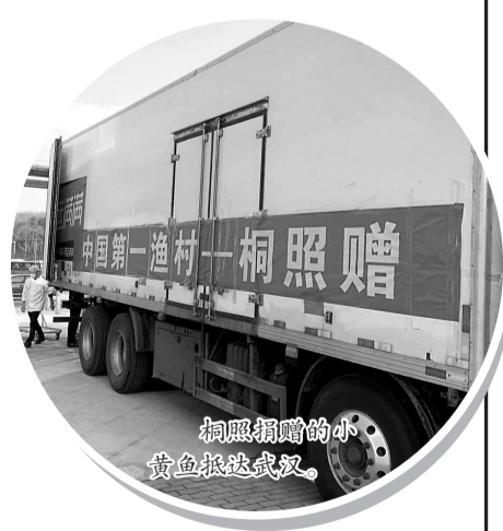
桐照捐赠的小黄鱼抵达武汉。