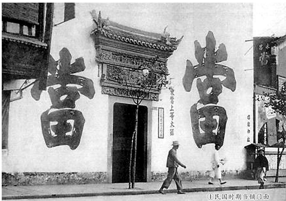
①民国时期当铺门面

金融业被誉为“百业之首”，在近代钱庄和银行出现之前，典当业是中国极其重要的金融业。从事典当的店铺，称为当铺（图一），是一种收取典押物进行放款的信用行业，运用货币资本生息图利。