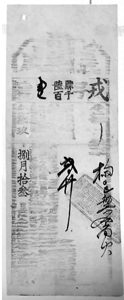
⑤慈溪义成当铺当票