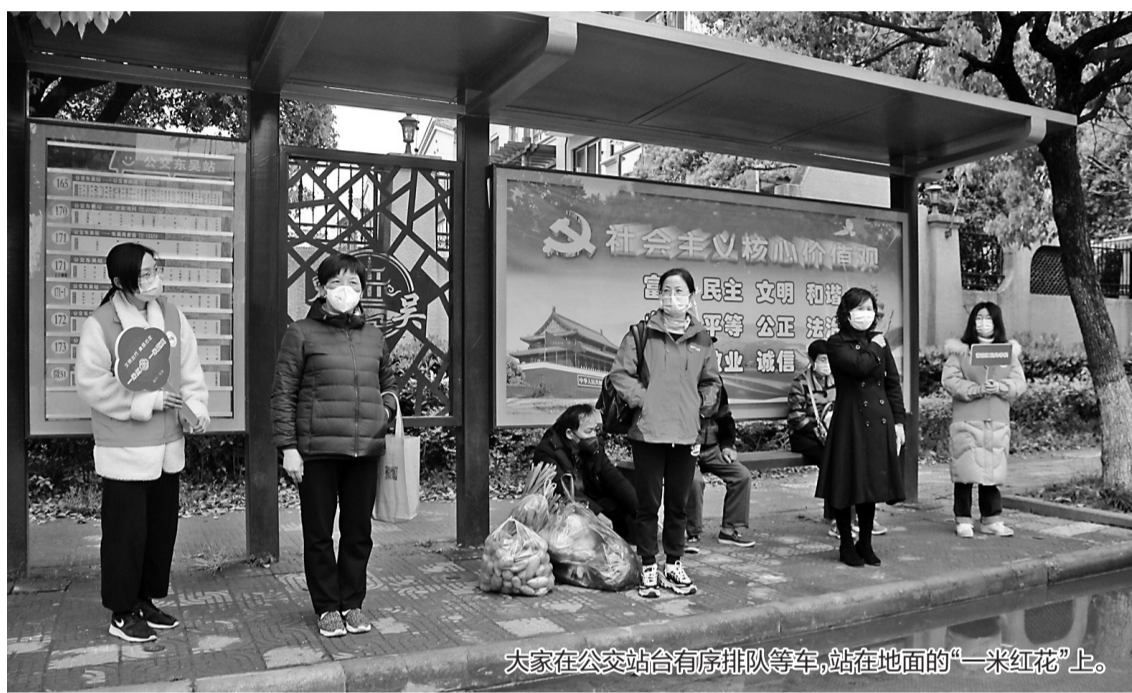
大家在公交站台有序排队候车,站在地面的“一米红花”上。

下个月开始,在鄞州东吴的沿街店铺、公交车站、办事大厅、银行等公共场所,“一米红花”很快将成为东吴小镇的标配。这其实是东吴镇发出的“美丽约定”,让村民自觉守护良好的文明习惯,让每个东吴人参与基层社会治理。