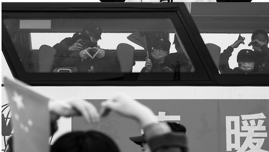
欢迎人群和医疗队队员隔着车窗玻璃“比心”。