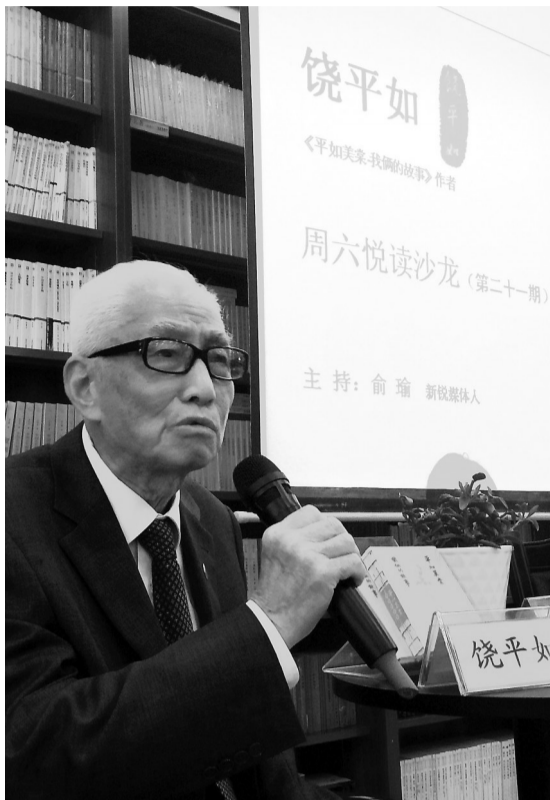
饶老6年前在甬与读者交流。

6年前,已是93岁高龄的饶平如曾经来到宁波。据时任鄞州书城经理范进剑回忆,当时饶老在鄞州书城与宁波读者进行了一次面对面交流,老人忆爱妻,聊画册,谈人生,他对爱情的真挚和对人生的豁达,感动了所有人。