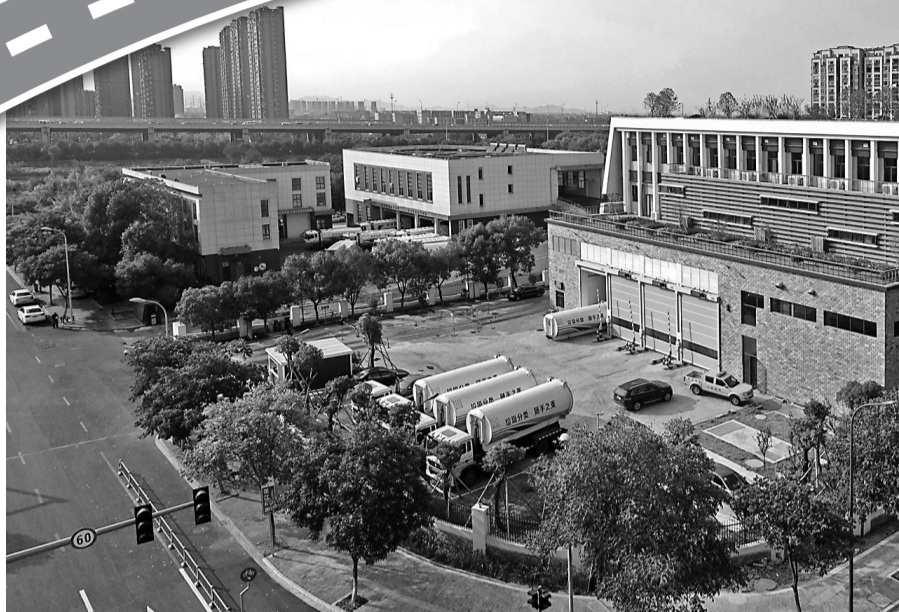
海曙区生活垃圾转运站。