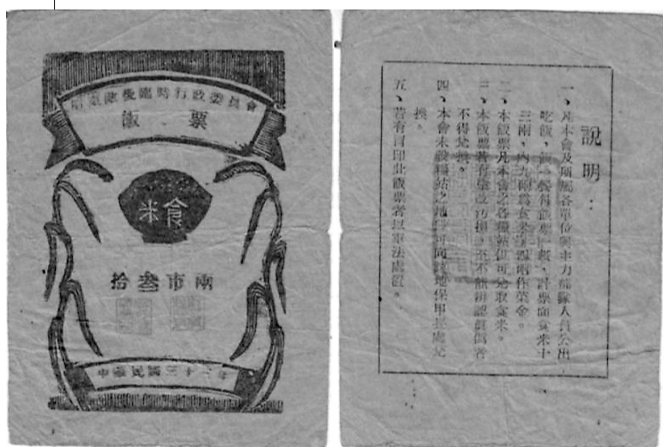
图一 浙东敌后临时行政委员会饭票十三两。

饭票的背面有这样一条说明:“饭一餐付饭票一纸,记票面食米十三两,内九两为食米,四两作菜金。”可见饭票是由食米和菜金构成。我们在资料中看到百姓捐款中出现“菜金抗币××元”等字样的记录,说明抗币可以用作捐款,用作生活中的交易。饭票收受者可用此来抵交公粮田赋 ② ,是一种有价凭证,是一种特殊的抗币。