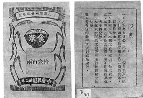
图二 三北游击司令部饭票十三市两。

1942年,共产党领导的抗日武装,开创了浙东三北敌后抗日根据地。1943年(民国三十二年)发行的,是三北游击司令部饭票(图二)。1944年1月15日,根据地在四明山菱湖村,成立了浙东敌后临时行政委员会,于是发行的是浙东敌后临时行政委员会饭票(图一)。1945年1月31日,建立浙东行政公署,发行的是浙东行政公署饭票(图三)。1945年9月底,主力部队北撤后,根据地设立浙东行署四明特办,发行的是浙东行署四明特办饭票(图四)。