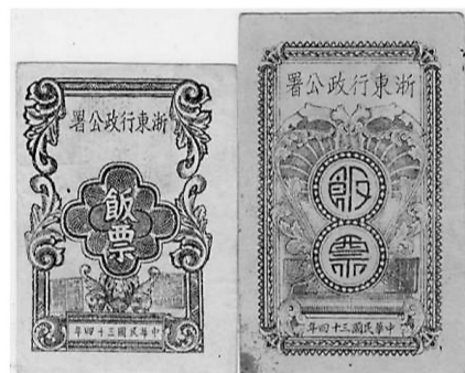
图三 浙东行政公署饭票十三市两。