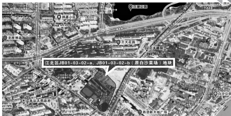
江北区JB01-03-02-a、JB01-03-02-b(原白沙菜场)地块

而下午的慈城新城宅地拍卖就显得有些冷。仅经9轮竞价，宝龙以6880元/m 2 的楼面价拿下，这个价格只高出起拍价80元/m 2 ，溢价率1.2%。