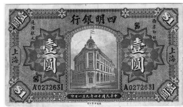
图五 民国十四年 德国版四明银行 一元券