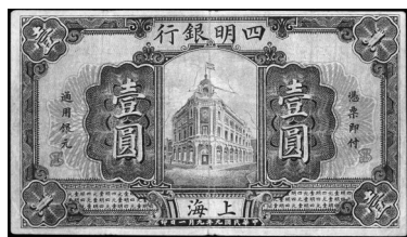
图一 民国九年 四明银行 一元券

财政部印制局印刷的上海四明银行一元券,代表了当时国内的最高水平,但是假票(图四)泛滥,表明与当时国外先进的印钞公司之间的差距,还是很大。在下一版(民国十四年)的四明银行纸币印制时,四明银行解除了与美国钞票公司的合同,改由德国钞票公司印制(图五)。