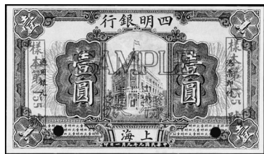
图二 民国九年 四明银行 一元券样本