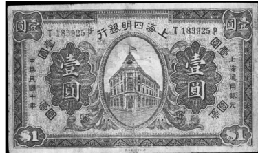
图四 上海四明银行 一元券老假票