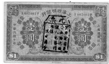
图三 民国九年 财政部印制局版 上海四明银行 一元券