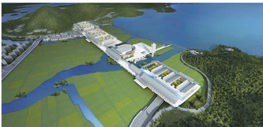
国际会议中心概念性方案图。

昨天,东钱湖畔一宗总用地面积22.7万余平方米的重量级地块正式挂牌——备受关注的宁波国际会议中心项目用地。