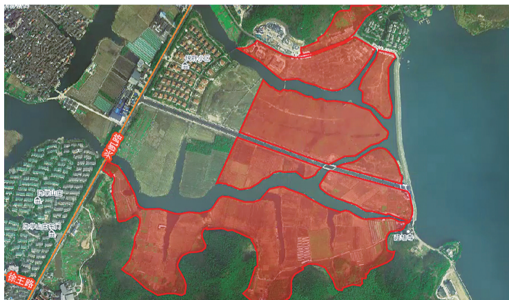
宁波2020年度供地计划中,国际会议中心地块的范围(红色区域)。

在项目概念性方案中,该区域的描述是:湖泊、河流、溪水、山涧、荷塘、水口、江岸,在这里汇聚;稻田、湿地,汇水而生。