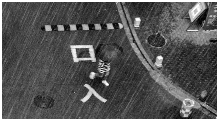
声势吓人的大雨。记者 刘波 摄