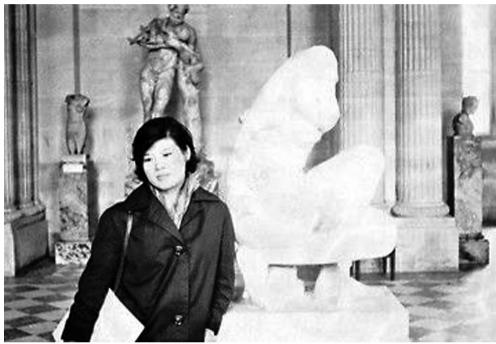
上世纪60年代,贺慕群在卢浮宫。

贺慕群,1924年生于宁波,继潘玉良之后的杰出华裔女艺术家,当年在巴黎期间,她几乎每天都去大茅舍艺术学院画画。作为留法中国艺术家共同的摇篮,常玉、潘玉良、赵无极都曾在该学院驻足学习。值得一提的是,之后贺慕群所使用的画室,也是赵无极曾经的工作室。旅法中国艺术家间的传承由此可见一斑。