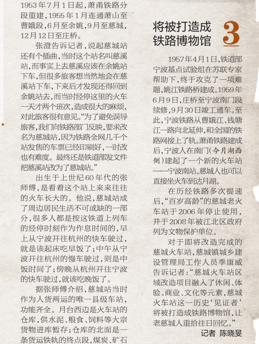
慈城火车站老照片。