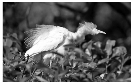
摄影 通讯员 卓松磊 王桂林