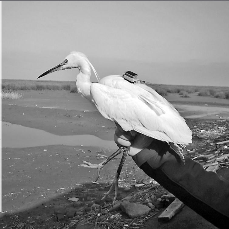
海选中脱颖而出的“小星云”，被安装了追踪器。

随着杭州湾湿地夏候鸟的迁徙回归，一年一度宁波杭州湾国家湿地公园观鸟季活动准时开启。每年此时都是中国林科院亚林所焦盛武博士最忙碌的时候，除了欣赏那些美丽的湿地精灵，他还要观察鹭鸟筑巢孵卵、研究它们的生活状态。与往年不同，今年焦盛武迫切等待的一只名叫“小星云”的白鹭，但截至目前，它依然没有回来。 “小星云”是谁？它又去哪里了？