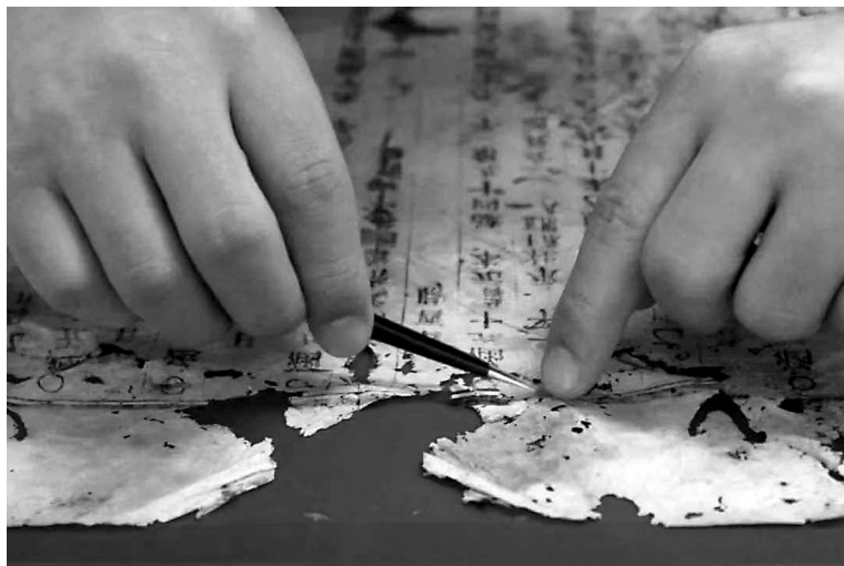
修复古籍是天一阁的一项绝技。

昨日,天一阁博物馆收到了国家古籍保护中心颁发的“国家级古籍修复技艺传习中心 天一阁博物馆传习所”牌匾,正式成为全国32家古籍修复技艺传习所之一,也是浙江省内获评的第二家。省内首家浙江图书馆。