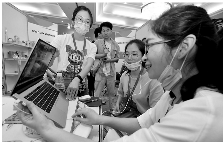
参展商户通过网络与境外客商洽谈。

本报讯(记者 严谨)在“2020中国(宁波)国际消费品博览会网上展”(以下简称“网上消博会”)线上举办的同时,配套的对接活动也在如火如荼地进行。