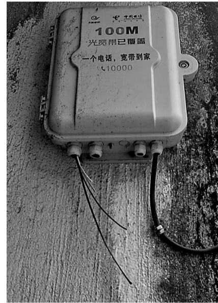
电信网线盒上的网线被剪断。

小区居民表示,老小区网络拉得像蜘蛛网,既不美观又存在安全隐患,整治清理本身是件好事,但剪网线也不能这么“粗暴”。