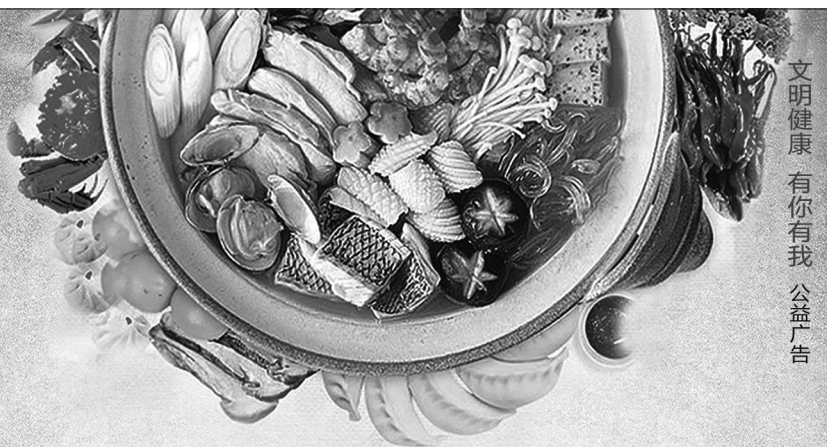
文明健康 有你有我 公益广告

记者在采访中了解到,该中心还构建多方联动的共管工作模式,要求以路段为单位建立管理中心、执法中队、相关社区、养护单位、沿街商户、物业公司共同参与的工作群,对巡查发现的问题实施综合、协调处置。开展常态化巡查,现场能处置的问题现场办结;现场不能办结的,明确职责由专人登记跟踪办结,职责外的问题落实专人转交相关责任单位;疑难问题由路段长牵头组织会商。