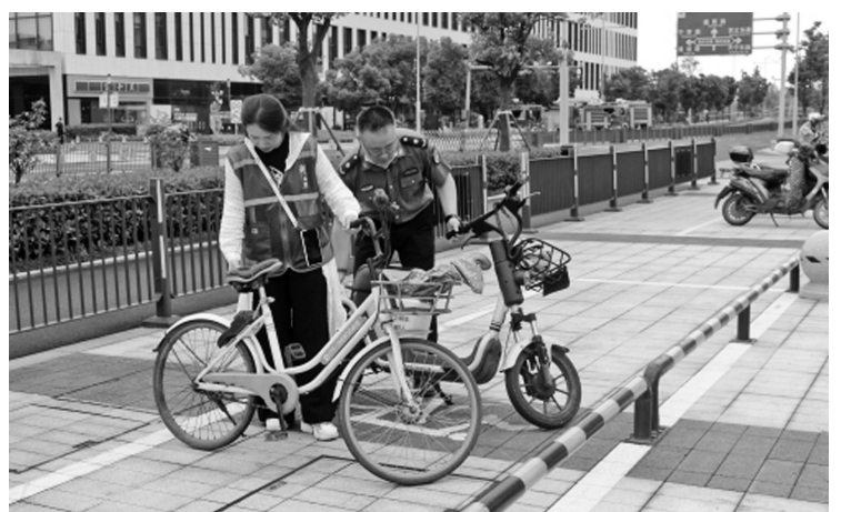
工作人员摆正街头的共享单车(电动自行车)。

本报讯(记者 边城雨 通讯员 李佳静)为进一步深化东部新城畅行行动,提升城市管理精细化水平,深化城区环境管理体制,使城市品位和群众生活品质从“面上”提升、在“质上”飞跃,按照全国文明城市创建检查标准和上级关于“一点通查”的工作要求,东部新城城市管理中心深入开展了区域路段长巡查工作。