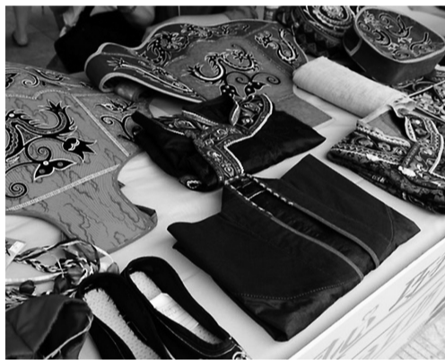
晴隆绣娘的手工作品。