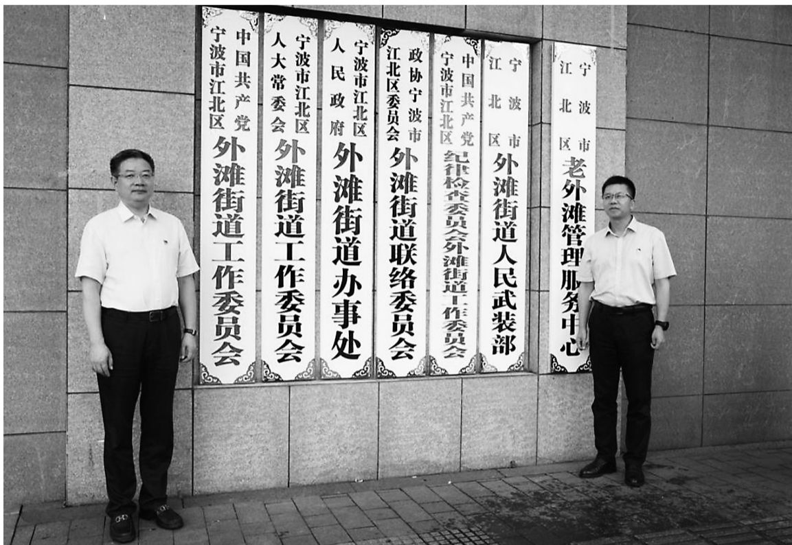
6月29日,宁波市江北区外滩街道挂牌。

6月29日下午,宁波市江北区外滩街道办事处正式挂牌成立。新成立的外滩街道由原中马街道和白沙街道合并而成,原沿江“断点”被疏通,宁波历史上的江北岸重新连成一片。