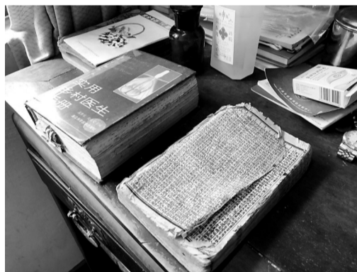
老人生前的桌上放着很多医学工具书。