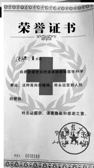
遗体捐献荣誉证书。